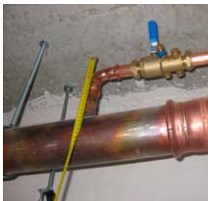
-Foto 1- Foutieve aansluiting brandslanghaspel

werkblad beschrijft welke terugstroombeveiliging geplaatst dient te worden bij het soort apparaat. Ondanks de beschikbaarheid van de waterwerkbladen worden er fouten gemaakt bij de aansluiting. Hiervan volgen enkele voorbeelden.